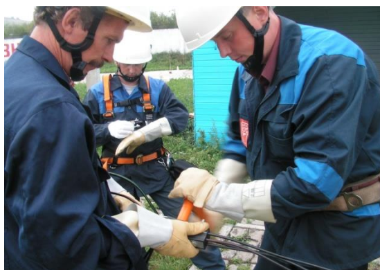
7. Установка зажима на земле

В зависимости от длины пролета и сечения жгута СИП, установку анкерных зажимов можно осуществлять на земле либо на опоре.