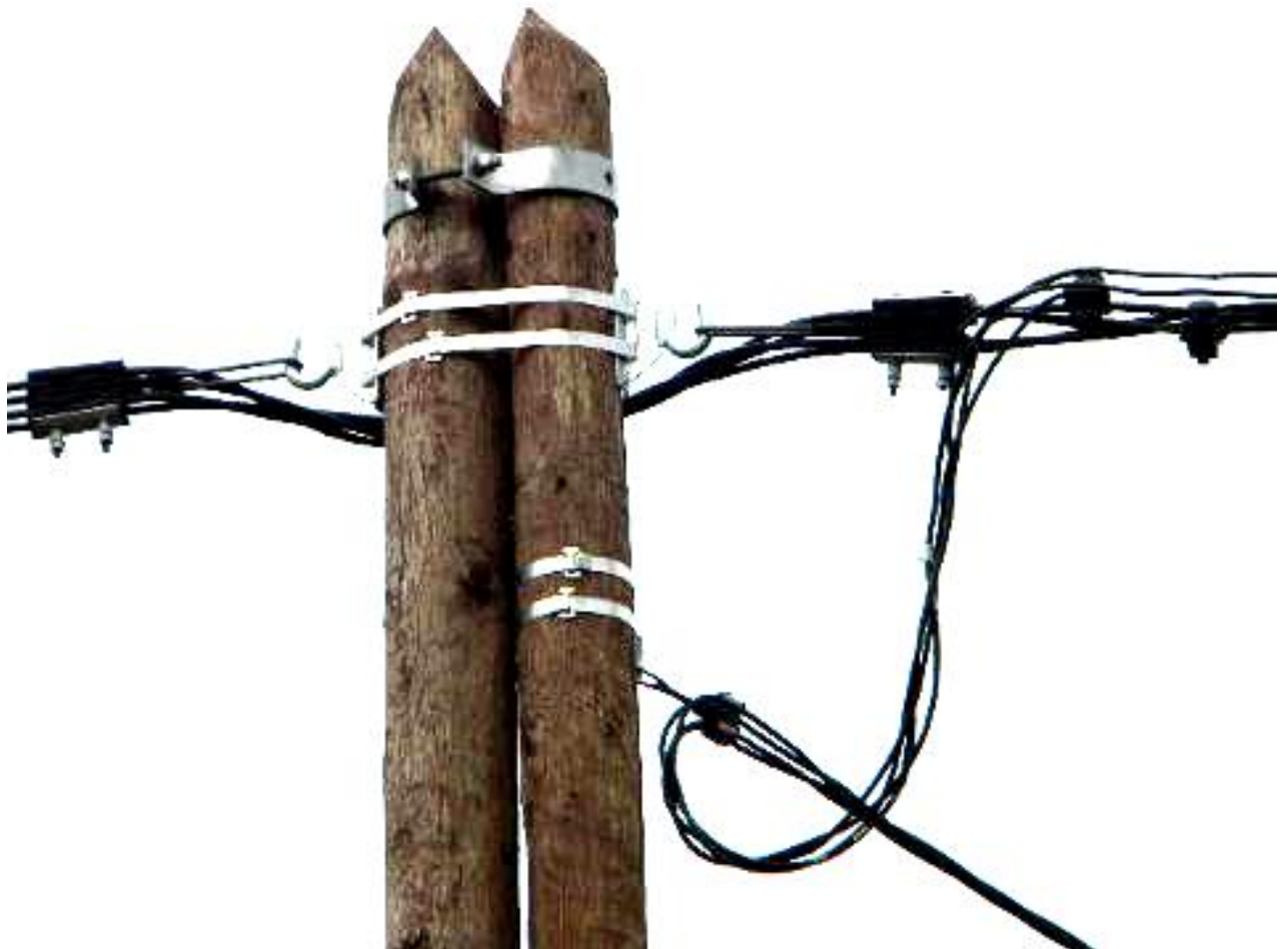
рис.11 Крепление анкерных зажимов ЗА-5 на опоре при помощи крюков КС и КБ