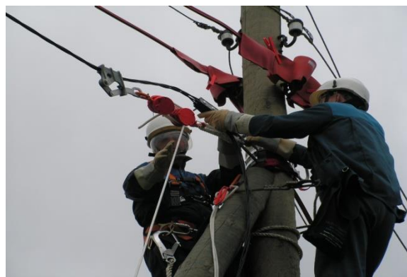
7. Установка зажима на опоре

Электромонтер, находящийся на опоре, осуществляет монтаж анкерного зажима. При этом для натяжения линии применяется ручная лебедка типа ЛБ-1500 и монтажный зажим H023 . При монтаже зажима анкерного на ВЛ-0.4кВ вблизи неизолированных проводов под напряжением, вместо лебедки применяется полиспаг H017RF с изоляционными блоками и канатом.