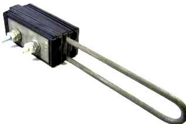
рис.1 Зажим анкерный ЗА-5