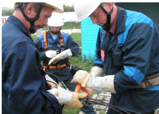
6. Установка зажима на земле

В зависимости от длины пролета и сечения жгута СИП, установку анкерных зажимов можно осуществлять на земле либо на опоре.