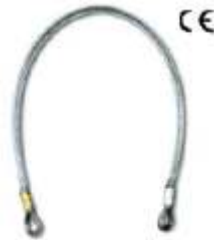
Зацеп тросовый СJ 100