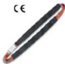
Зацеп ленточный СВ 200

При натяжении проводов ВЛ для закрепления крюка лебедки к опоре служит зацеп ленточный типа СВ200 либо зацеп тросовый типаСJ100